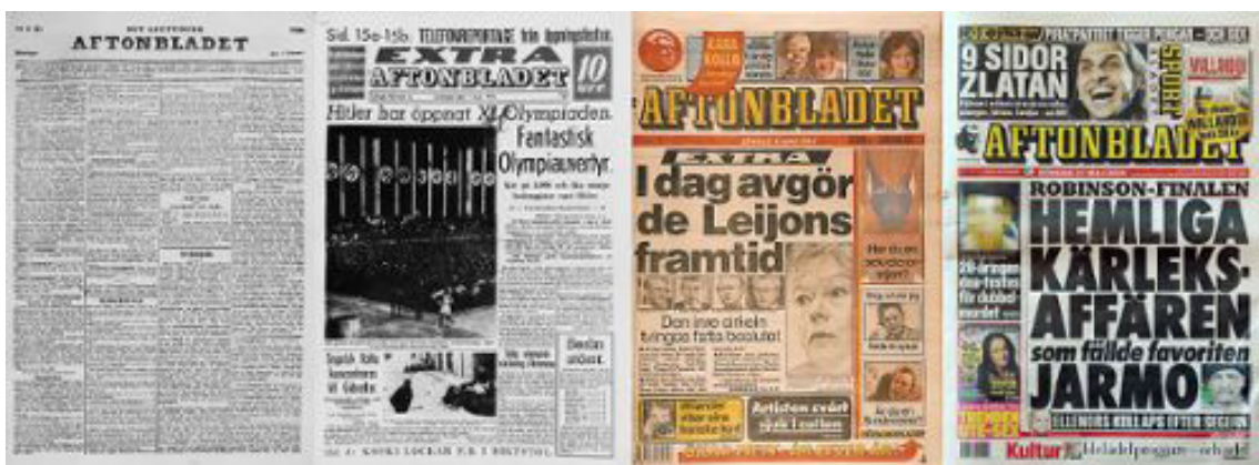
■ Tidningen Aftonbladets första nummer kom ut 6 december 1830. Längst till höger förstasidan på samma tidning 31 maj 2009.

Vi har till exempel en lång tradition av yttrandefrihet i vårt land. Vi får fritt uttrycka våra åsikter och också framföra detta i pressen. Därför har tidningar kunnat startas utan politiska hinder.