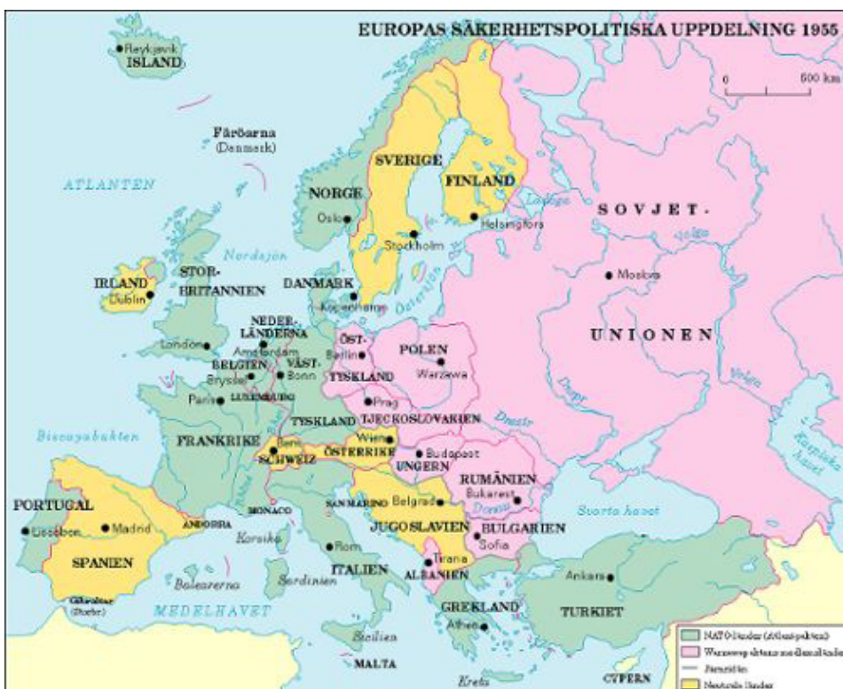
■ Karta över Europa 1955 med järnridån och de två försvarsallianserna NATO och Warszawapakten.

År 1949 bildade USA, Canada, Storbritannien, Frankrike, Beneluxländerna, Italien, Portugal, Danmark, Norge och Island försvarsförbundet NATO (North Atlantic Treaty Organization), som även kallas Atlantpakten. Vid krig skulle medlemmarna hjälpa varandra. Sovjetunionen och Östeuropa planerade ett liknande försvarsförbund och 1955 bildades Warszawapakten .