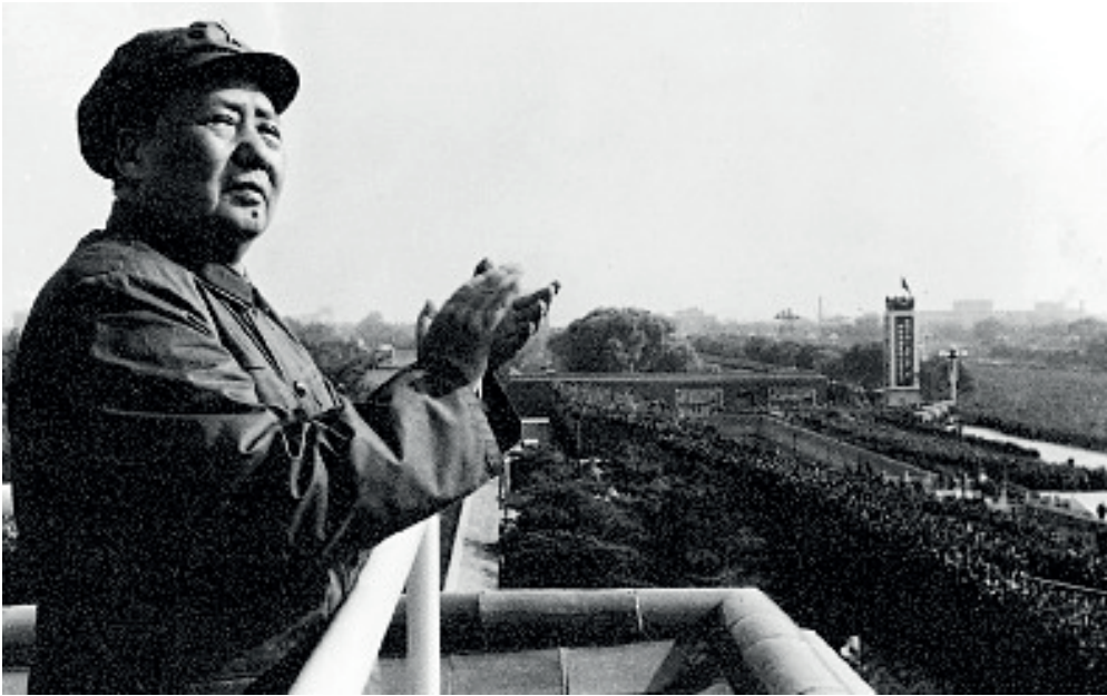
■ Mao Zedong.

Kina har styrts av Kinas kommunistiska parti sedan 1949 och heter officiellt Folkrepubliken Kina. Efter ledaren Mao Zedongs död 1976 började ekonomiska reformer genomföras. Så kallad socialistisk marknadsekonomi infördes, det blev tillåtet att starta privata företag och utländska investeringar välkomnades. Kina har under många år haft en kraftig ekonomisk tillväxt och har blivit en ekonomisk stormakt. Inkomstskillnaderna är dock mycket stora inom landet.